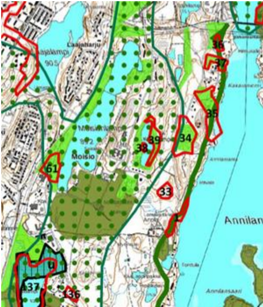
Kuva 2. Mikkelin kantakaupungin osayleiskaava (viherrakennekartta).